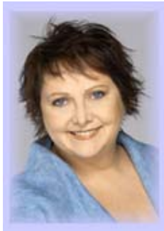
Madame Francine Ruel porte-parole du Programme québécois DE DÉPISTAGE DU CANCER DU SEIN

Depuis l'automne 2005, madame Francine Ruel, auteure et comédienne a accepté d'être la porte-parole du PQDCS car, pour elle, la santé des femmes est importante.